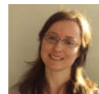
Jo Barreau Écossaise,

La mission d'ImpaQt est d'offrir aux entreprises et à leur personnel des solutions flexibles et dynamiques pour communiquer avec excellence sur le plan international tout en respectant leurs objectifs stratégiques et opérationnels. D'autres professionnels de régions ou nationalités diverses interviendront à l'occasion de sessions dédiées à des pays spécifiques (Focus Irlande, Canada, Afrique du Sud, Australie...)