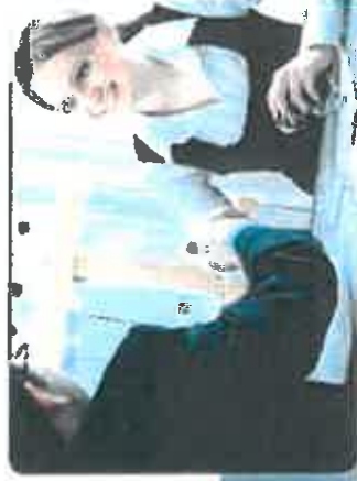
Le prix de cette prestation ne comprend pas les éventuels frais dus au Greffe

Le CFE est partie de plus proches de la CCI Ce qui vous évite les formalités liées à l'Entreprise (formalités et cotisations de la CCI), les cotisations d'assurance et les cotisations de vos salariés