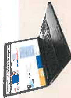
janvier 2010

Pour vos formalités sur Internet www.cfenet.cci.fr