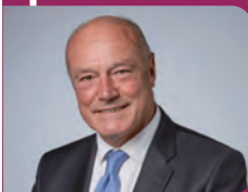
Alain ROUSSET Président de la Région Nouvelle-Aquitaine

Face aux défis inédits à relever à cette nouvelle échelle, en termes notamment de proximité, d'adaptation aux contextes territoriaux et de manière plus générale d'efficacité de l'action publique et parapublique en direction des entreprises, nous partageons le même volontarisme pour faire de notre territoire un fer de lance du renouveau industriel français.